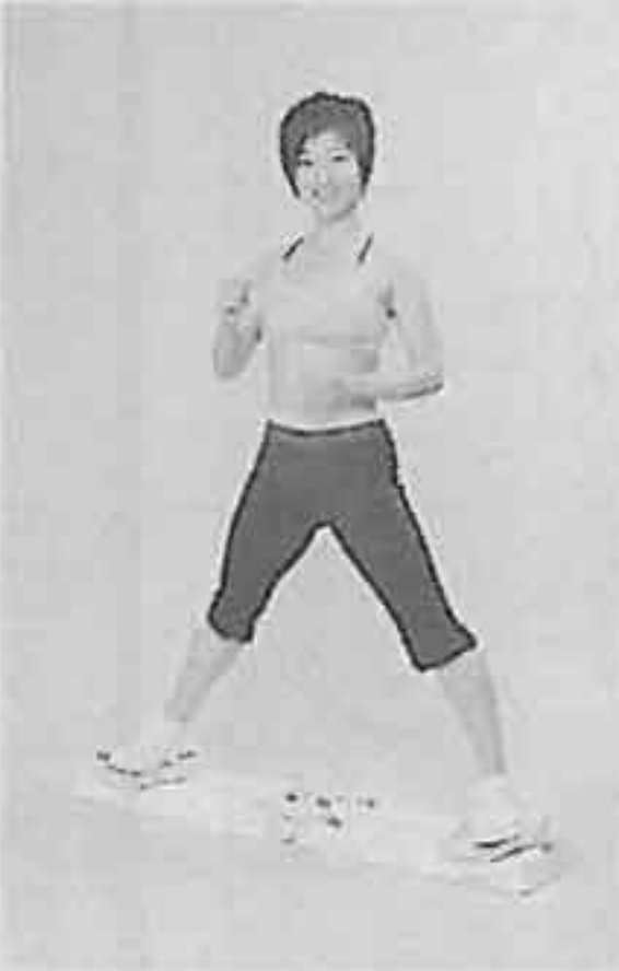
「内股シェイプスライダー」

30センチ、高さ8・5センチとコンパクトで、折りたたんで収納できるため、部屋の広さを問わない。価格は1万4